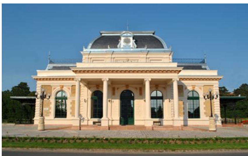
Gödöllő – vasúti királyi váró